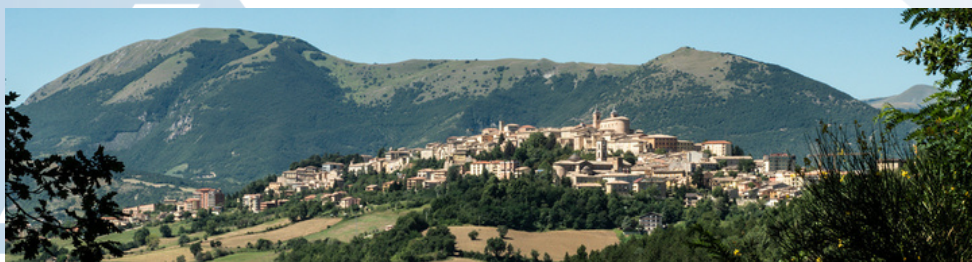
Panorama della città di Camerino

Camerino è un luogo ideale per immergersi nella storia, esplorare la natura e godersi l'autentica cultura italiana.